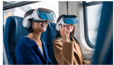
デジタルエンタメトレイン

MR等のデジタル技術を活用し、旅行の出発地から新幹線等の移動空間の中までも、関連コンテンツを楽しんでいただけるような新しい没入体験を創出していきます。