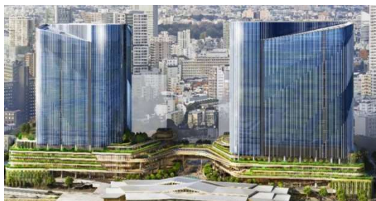
TAKANAWA GATEWAY CITY

松竹の「THE LINKPILLAR 1 SOUTH」への入居やビジネス創造施設「TAKANAWA GATEWAY Link Scholars' Hub」(LiSH)や「東京大学 GATEWAY Campus」との連携、複合文化施設「MoN Takanawa: The Museum of Narratives」での協業を通じ、両社グループの取り組みを加速させます。