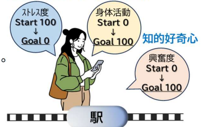
健康状態の可視化