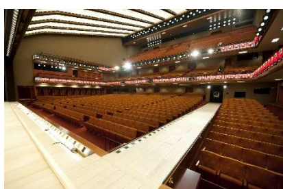
舞台下手より客席