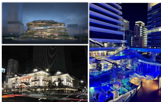
ナイトタイムエコノミー

両社の施設が東京湾に面して近接して立地する「高輪」、「浜松町・竹芝」、「東銀座」エリア一体で、地域の自然や文化施設・史跡や水上交通を活かした、文化的に豊かな夜時間の過ごし方を提案します。