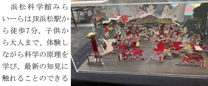
「信濃川中嶋大合戦組上」

静岡県の浜松科学館みらいーらでは、現在開催中の夏の特別展「 しかけ絵本でサイエンス! 」にて、当館所蔵の組上燈籠絵(複製)の完成形が4点展示されています。当館から提供したデジタルデータをもとに、浜松科学館のスタッフの方々が完成形を組上げてくださったもので、初日から多くの来館者の方にご覧いただいているとのことです。