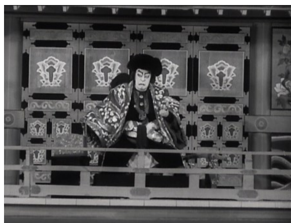
『楼門五三桐』