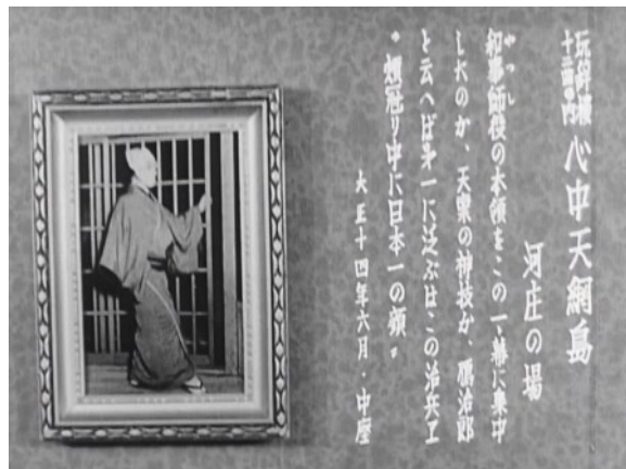
『中村鴈治郎 舞台のおもかげ』

当館の創立者・大谷竹次郎と、兄・白井松次郎が歌舞伎の名舞台を映像に残そうと尽力した、貴重な歌舞伎映画フィルムです。この機会に、ぜひご覧ください。詳しくは衛星劇場の「歌舞伎ラインナップ」特設サイト( https://www.eigeki.com/special/kabukilineup )をご覧ください。