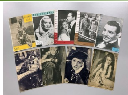
松竹座ニュース(昭和9年昭和13年)

そして右の写真は、映画上映専門劇場の頃の「松竹座ニュース」です。松竹楽劇部が「大阪松竹少女歌劇」と改称し、昭和9[1934]年8月に新装開場し