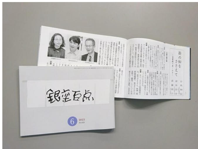
月刊誌『銀座百点』2023年6月号表紙と「巻頭座談会」

『銀座百点』HP： http://www.hyakuten.or.jp/index.html