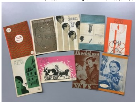
「松竹座ニュース(S.P)」(昭和6年-昭和8年)

下の写真は、昭和6[1931]年-昭和8[1933]年の「松竹座ニュース」です。表紙に「S.P」の表記があり、これは「松竹パラマウント(松竹竹社興行社)」の略称です。