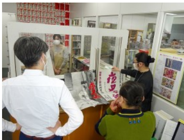
映画『夜叉ヶ池』ポスターのご説明