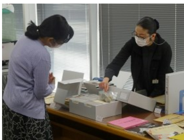
「歌舞伎プロマイド」保存箱のご説明