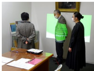
閲覧室展示「篠田正浩監督生誕90年展」のご説明