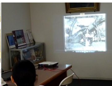
『紅葉狩』「谷版」の上映