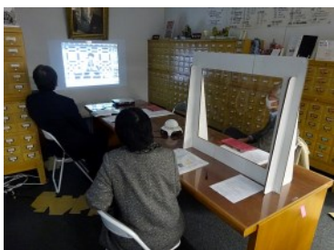
『楼門五三桐』の上映