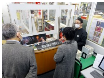
映画『夜叉ヶ池』ロビーカードとステール写真のご説明