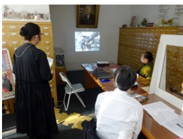
『紅葉狩』「大谷家版」の上映