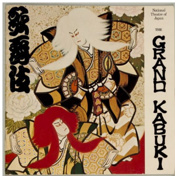
1979年1月-2月 アメリカ公演プログラム

https://www.kabuki-bitto.jp/special/more/more-other/post-grandkabukihistory-2/