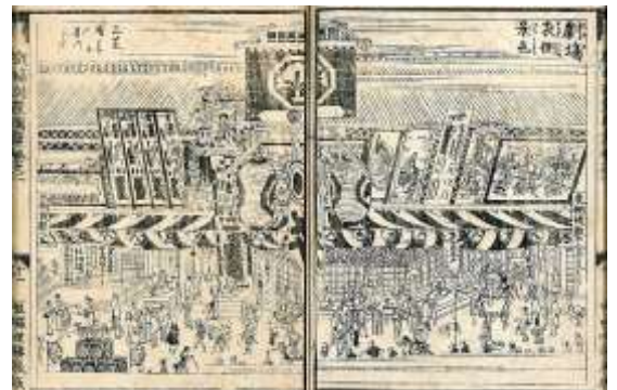
「劇場(中村座)表側景色」(『劇場訓蒙図彙しばいきんもうづい』巻之一(享和三年初版)より)

現在中央区で興行を続けている主な劇場、歌舞伎座、明治座、新橋演舞場、三越劇場、東京劇場(現在は映画館)は、戦前から同じ場所にあり、その場所と歴史について、地図を使い説明した。歌舞伎座は明治22(1889)年に現在地で初開場、また、明治座はその前身である喜昇座が、現在地近くに建てられたのが明治6(1873)年である。さらに江戸時代に遡ると、江戸で最初の官許の劇場中村座は、寛永元(1624)年、現在の東京駅から程近い、日本橋と京橋の間にあった中橋で櫓を挙げている。その後、中村座は禰宜町(日本橋堀留町)への移転を経て、慶安4(1651)年、堺町(日本橋人形町)に移転する。禰宜町の近く、萱屋町(日本橋堀留町)には、寛永11(1634)年、市村座が櫓を挙げ、また、現在の歌舞伎座周辺の木挽町(銀座)には、寛永19(1642)年に山村座(1714年廃座)、慶安元(1648)年に河原崎座(1663年休座)、そして万治3(1660)年に森田座が建つ。これらの江戸の主な劇場は、天保の改革で、天保12(1842)~13(1843)年に浅草の猿若町に移転するまで、実に200年以上も中央区で興行を続けていた。