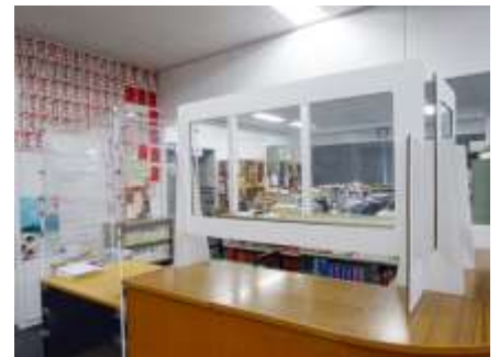
閲覧室カウンターに設置したビニールシート(左)と段ボールパーテーション

今後、開館日時やご利用方法につきましては、状況の変化にともない変更の可能性があります。 随時お電話でのご確認や、当館のHP、 Facebook の更新をご確認下さい。 ご理解ご協力の程、よろしくお願い申し上げます。