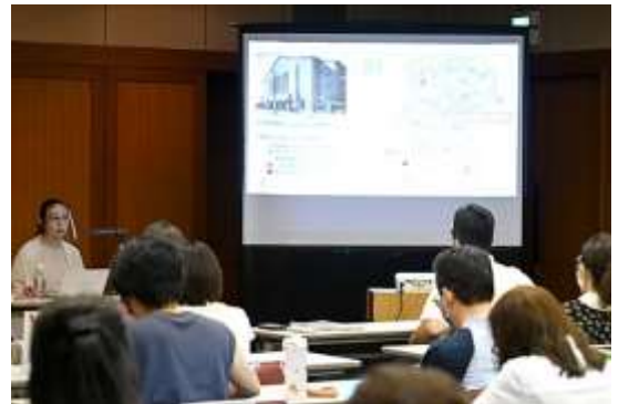
当日の会場の様子。

一時期より感染者数が落ち着いてきているとは言え、人がある程度集まる講座であり、新型コロナウイルス感染防止対策として、会場の入口では検温と健康状態のチェックを実施し、会場の扉も換気のため開放し、通常は120名入る会場に、今回は三分の一の40名近くの聴講者を迎えての開催であった。今回の聴講者は中央区在住か在勤に限られ、また多くが歌舞伎の観劇経験があるという事で、まず、中央区と芝居の関係の深さから講座を始めた。