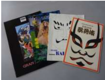
5号『平家女護島 俊寛』で紹介した資料 『俊寛』上演時の海外公演プログラム(右より)1967年ハワイ公演、1961年ソ連公演、1988年エジプト公演、1996年イタリア公演

↓バックナンバーの購入はこちら https://www.hcj-shop.jp/