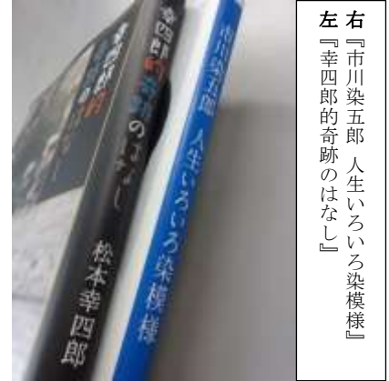
左 『市川染五郎 人生いろいろ染模様』 右 『幸四郎的奇跡のはなし』

本年1月2日より歌舞伎座で、「壽初春大歌舞伎 高麗屋三代同時襲名披露興行」が幕を開けました。昭和56年10月の歌舞伎界で初となる直系の親子孫三代（初代松本白鸚、九代目松本幸四郎、七代目市川染五郎）の襲名以来、37年ぶりに松本幸四郎改め二代目松本白鸚、市川染五郎改め十代目松本幸四郎、松本金太郎改め八代目市川染五郎へと、それぞれ父が名乗っていた名前を受け継ぎます。歌舞伎はもちろん、ミュージカルや現代劇、そして映画、テレビなどジャンルを超えて幅広く活躍し続けている高麗屋三代の魅力に、所蔵資料から迫ります。数多く著書が出版されている二代目松本白鸚と十代目松本幸四郎。もちろん、当館にもたくさんの蔵書があります。残念ながら展示スペースの都合で展示できませんでしたが、その中から『幸四郎的奇跡のはなし』（2011年 東京新聞）と『市川染五郎 人生いろいろ染模様』（2015年 世界文化社）の2冊をご紹介します。この2冊には二代目白鸚が染五郎時代に主演した大河ドラマ『黄金の日々』の興味深いエピソードが載っています。『黄金の日々』の第1話のテレビ放送日はちょうど、息子・十代目幸四郎の5歳の誕生日でした。そのプレゼントとして親子で一緒にテレビで第1話の放送を観ることとなり、見終わった後、“お芝居の人になりたい”と母親に告げたことで彼の役者人生が始まったそうです。このエピソードを、親の目から見た話（『幸四郎的奇跡のはなし』）と子供の目から見た話（『市川染五郎 人生いろいろ染模様』）、それぞれのエッセーが楽しめます。