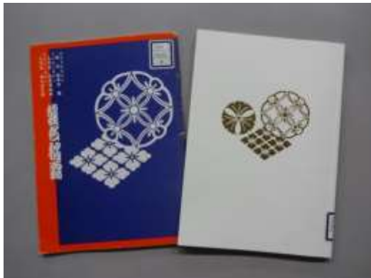
左 『初代松本白鸚 九代目松本幸四郎 七代目市川染五郎襲名披露』、右 『二代目松本白鸚 十代目松本幸四郎 八代目市川染五郎襲名披露』

当館閲覧室奥にある展示ケースを臨むと、三代襲名口上の2枚の大きなカラー写真（複製）が真っ先に目に入るかと思えます。上は37年前の襲名時のもの、下は今回の三代襲名の写真です。『初代松本白鸚 九代目松本幸四郎 七代目市川染五郎襲名披露』、『二代目松本白鸚 十代目松本幸四郎 八代目市川染五郎襲名披露』にそれぞれ掲載されているので、カウンターで請求していただければ、お手に取って読むことができます。ぜひあわせてお楽しみください。