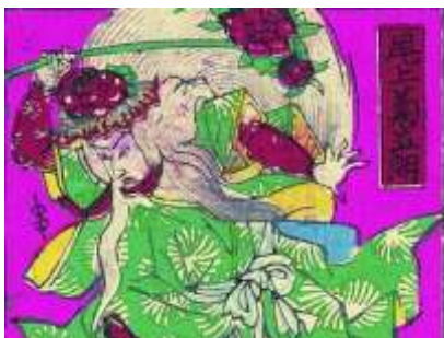
組上燈籠絵『石橋』人物部分【拡大】