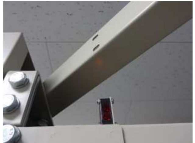
書架上部に新たに設置されたセンサー

9月29日の館内整理休館日に、棚の構造上修理が難しく、8月の作業で残ってしまった書架の修理を業者さんにしていただきました。今回修理したブロックは、センサーが壊れたままで調整が効かないため、書架の移動が自動では止まらない状態でした。このブロックは鉄製のキャビネットを搭載しているため、書架下部にあるセンサーが修理できず、上部に新たにセンサーを設置していただきました。 他の部品も徐々に経年劣化が進んでいるとのことで、まだ不安を抱えている書庫ではありますが、現時点での運用に支障が出ないよう、修理をしてもらいました。 これで、当館スタッフのスムーズな出納が再びできるようになりましたので、安心して資料をご請求下さい。 皆さまのご来館、心よりお待ちしております！